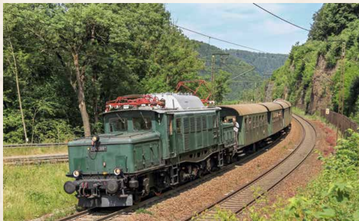
Der „Feurige Elias“ mit der E94 088 auf der Geislinger Steige.

Tragen Sie sich unter www.ges-ev.de/Kontakt für unseren Newsletter ein - so erhalten Sie stets die neuesten Informationen rund um unsere Fahrten und sonstigen Veranstaltungen.